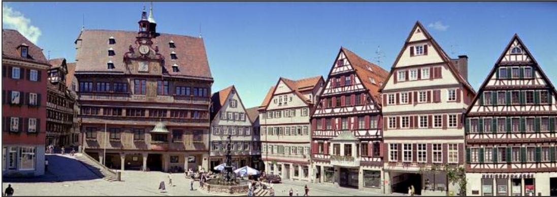
Tübingen: 85 000 Einwohner